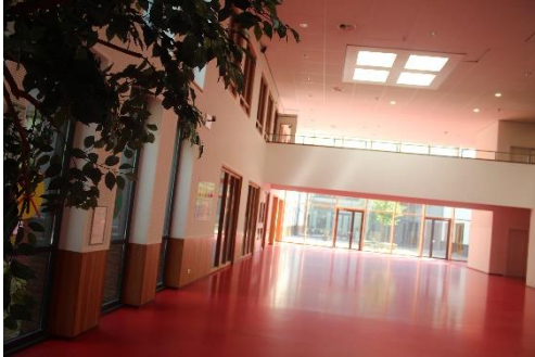
Een lege ruimte in De Bloesem; geschikt voor een terugkomst van de bibliotheek

De inspanningen die de Gemeente op dit vlak heeft verricht en nog verricht, verdient een breder vervolg om deze groep zo goed mogelijk te begeleiden.