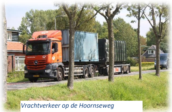
Vrachtverkeer op de Hoornseweg

Met betrekking tot de bestemming Roele De Vries zou een oplossing voor een andere ontsluitingsweg wenselijk zijn (via Westerspoor of nieuwe route). Aandacht wordt gevraagd voor de aanrijroutes bevoorrading winkels.