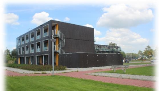
Appartementencomplex voor statushouders en starters

Er bestaat behoefte aan aparte appartementencomplexen voor jongeren én voor ouderen (deze laatste inclusief voorziening als lift). Gemengde bewoning heeft vanuit het verleden bewezen niet goed te werken. De beide groeperingen hebben o.a. een heel ander levensritme en andere verwachtingen van de woning. Kijk “out of the box” naar bv wonen in kantoorcomplexen e.d.; Bouw van