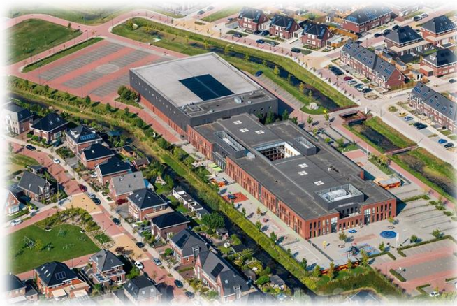
De basisscholen in het MFC De Bloesem

Om e.e.a. veiliger te laten verlopen zou ter plekke een Schoolzone kunnen worden ingesteld.