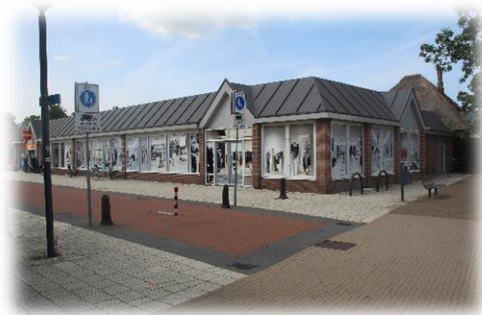
Voormalige "Blokker" winkel ; leegstaand

Het winkelcentrum wordt ervaren als ietwat saai. Op vrijdag is er een beperkte markt, die wel wat kleur brengt, maar een aankleding met meer groen, enkele vlaggenmasten, minder blinde gevels en betere bewegwijzering (ook er naartoe) wordt door zowel winkeliers als bewoners op prijs gesteld.