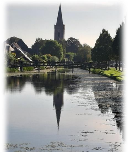
Wognum, de Parel van West-Friesland

Ons dorp herbergt zo'n 6200 inwoners. Het is een aantrekkelijke woongemeente met goede ontsluitingswegen als A7, N241 en N307. De directe woonomgeving wordt als zeer prettig ervaren. Ook de saamhorigheid binnen Wognum wordt met name genoemd. Zo'n 63% van de inwoners is betrokken bij een vereniging of club en meer dan de helft is actief als vrijwilliger. Een kwart is afgelopen jaar actief geweest in Wognum om de leefbaarheid en/of veiligheid te verbeteren. Deze cijfers geven wel aan dat we trots mogen zijn op ons dorp. De leefbaarheid, het woongenot, het aanbod van zorg en de aanwezigheid van vele verenigingen maakt dat we leven in de "Parel van West-Friesland".