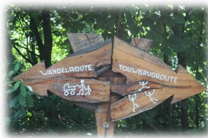
Bewegen in Wognum; Kreekbos

Gelukkig kent Wognum vele verenigingen waar dit mogelijk is. Toch zijn er ook gedachten om in de wijken zelf bewegingsapparaten voor volwassenen te plaatsen en/of in het Kreekbos een bewegingsroute aan te leggen, zodat men ook gestimuleerd wordt om te bewegen. De Gemeente kan hier een rol in spelen door de komende tien jaar elk jaar in de begroting ruimte te creëren om bewegingsapparaten c.q. bewegingsroutes te plaatsen/te realiseren.